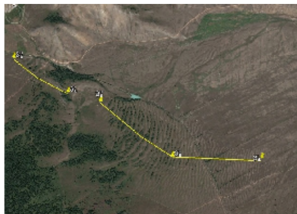
Георадарные профили по грядовому полю в районе Актру Курайской котловины Горного Алтая

Все профили показали сходное строение гряд и свидетельствуют об их образовании в ходе водного транспорта отложений, слагавших дно Курайской впадины и речные террасы Катунь.