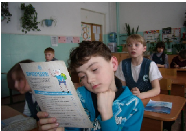
Участие в проекте Алтайского краевого детского экологического центра