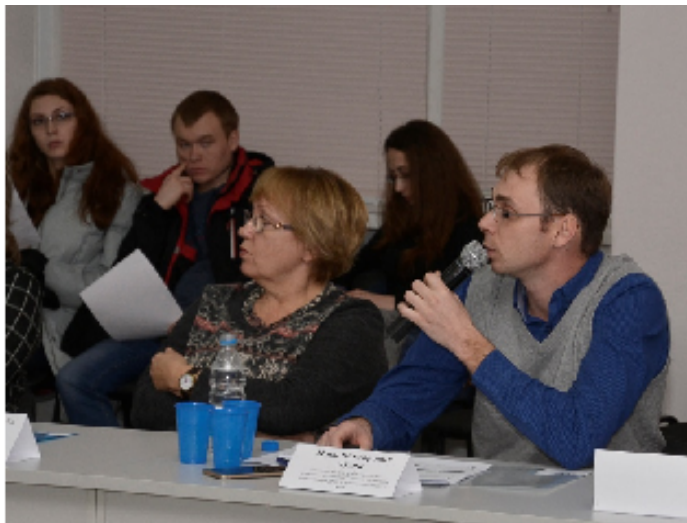
Выступление участников круглого стола

Программа Круглого стола состояла из двух частей: доклады и сообщения; обсуждение и подведение итогов круглого стола. В заседании приняли участие представители органов власти, ученые, сотрудники заповедных территорий, преподаватели и студенты профильных специальностей, а также представители природоохранных общественных организаций. В результате участники Круглого стола сошлись в едином мнении: туризм и охрана природы относятся к различным видам деятельности, и между ними возможны серьезные конфликты интересов.