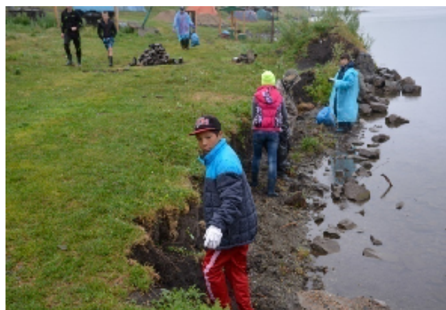
Участие школьников в экологической акции на оз. Белое

Участники экспедиции узнали об экологических проблемах Курьинского района Алтайского края, в т.ч. связанный с рекреационным природопользованием. Осуществлен сбор мусора с мест неорганизованных стоянок.