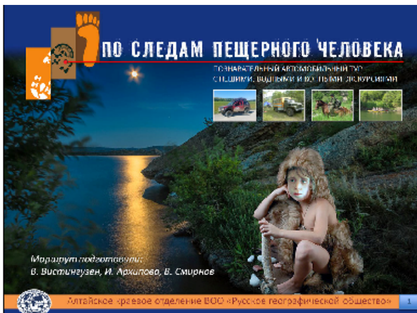
Презентация маршрута «По следам пещерного человека»

Маршрут предусматривает посещение около десяти исторических пещер, в том числе с палеолитическими стоянками; три сохранившихся укрепления Колывано-Кузнецкой оборонительной линии XVIII века; Ново-Чагырский полиметаллический рудник XIX века, Колыванскую шлифовальную фабрику, несколько музеев; а также горы Синюхи; знакомство с обликом исторической части городов Барнаул и Змеиногорск.