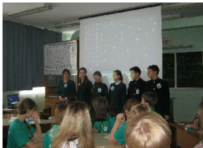
Экологический марафон «Наш дом-Земля»

В 2015 г. экологический марафон «Наш дом – Земля» был посвящен особо охраняемым природным территориям мира, России и Алтайского края. Уже с 2010 г. это интеллектуальное состязание, состоящее из 4-х этапов, проводится при поддержке и участии социальных партнёров: Детский эколого-биологический центр г. Бийска и заповедника Тигирекский. В этом году в конкурсе приняли участие школьники из 20 образовательных учреждений Бийского округа.