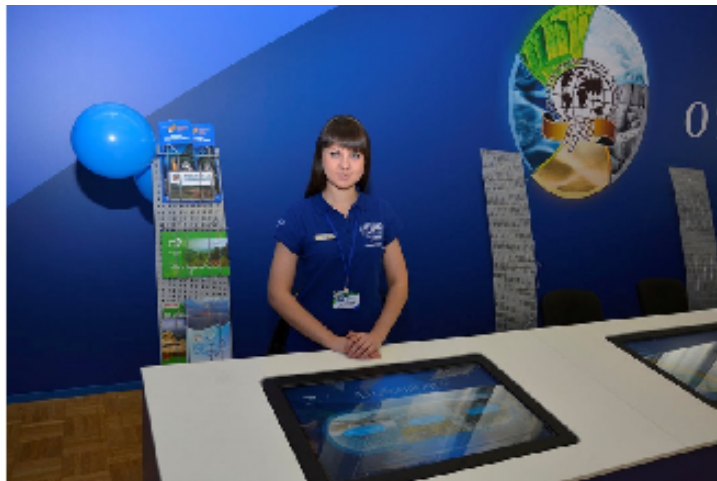
Алтайский край на II Фестивале РГО

Презентационные материалы для представления Алтайского края на мероприятии были подготовлены при поддержке Администрации Алтайского края, Попечительского совета АКОРГО и КГБУ «Туристский центр Алтайского края».