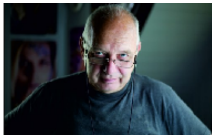
Творческая встреча с фотографом А. Лыскиным