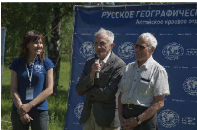
Открытие Летней школы Почетным председателем РГО, ак. В.М. Котляковым

Летняя школа – это коммуникативно-образовательный проект Алтайского краевого отделения Русского географического общества, реализуемый с 2014 года совместно с Алтайским государственным университетом при поддержке Попечительского совета АКОРГО. Занятия в рамках школы построены в виде дискуссионных лекций, творческих встреч, мастер-классов, полевых выходов, квестов и викторин. Организаторы и учителя готовят для ребят разнообразную развлекательную и спортивную программу.