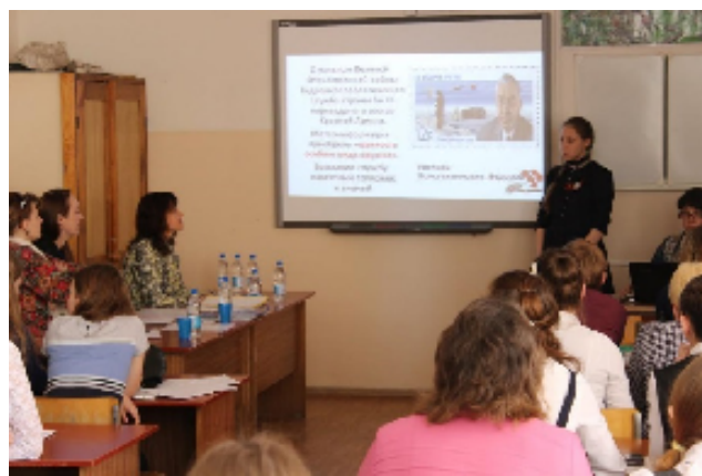
Работа секции «Географы для Победы!»