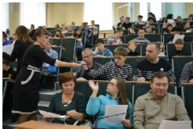
Площадка Алтайского государственного технического университета

Проверить знания по географии пришли более 500 человек. Среди них школьники, учителя, студенты, выпускники географического факультета, члены Русского географического общества, активные туристы и путешественники, а также люди, не имеющие отношения к географии – спортсмены, домохозяйки и многие другие.