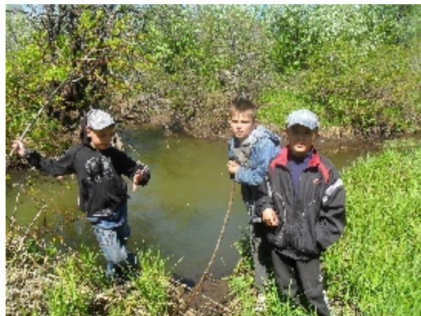
На слиянии рек Зудилихи и Черемшанки

По результатам проведенной работы в 2015 г. под эгидой АКОРГО подготовлен видеофильм «О маленькой речке замолвите слово», посвященный проблемам малых рек правобережья р. Обь.