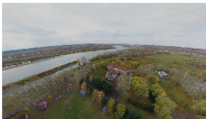
Место проведение фестиваля. Санаторий «Рассветы над Бией»

В октябре 2015 г. в Бийском районе в санатории «Рассветы над Бией» в третий раз прошел фестиваль профессиональных и любительских туристических и спортивных фильмов. На конкурс было прислано более 70 работ из регионов Сибири, Москвы, Московской и Архангельской областей, Санкт-Петербурга, Республики Крым по номинациям: «Туризм», «Спорт», «Природа», «Экология» и «Одноминутный фильм».