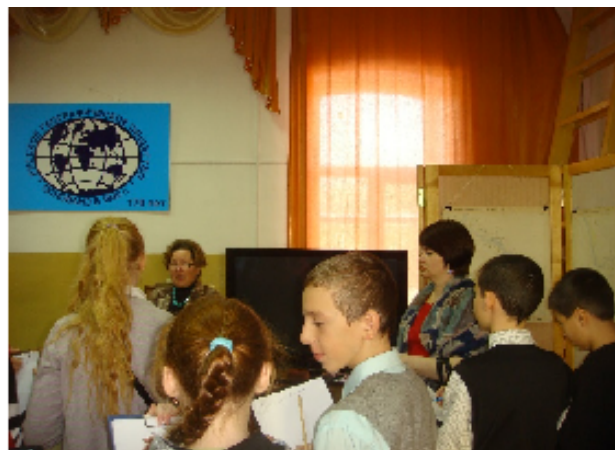
Выставка, посвященная 60-летию Алтайского отделения РГО в городе Бийске

Посетители получили возможность увидеть подлинные карты Вячеслава Шишкова, а также другие редкие экспонаты, принадлежащие краеведам и исследователям Алтая.