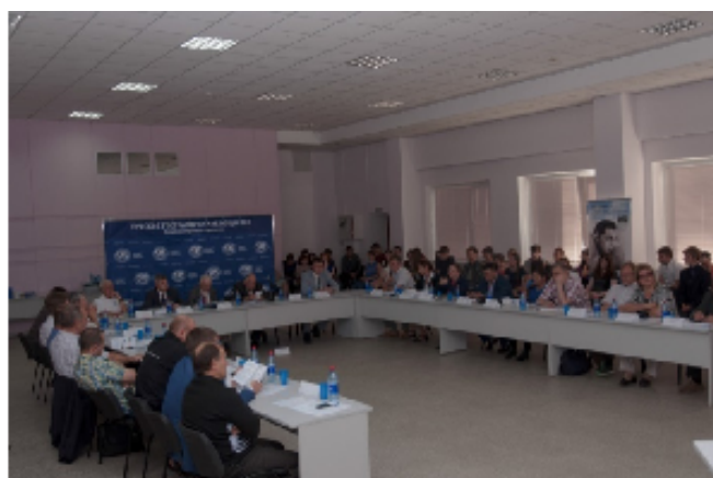
Круглый стол «Туризм и разнообразие его форм в трансграничном Алтае-Саянском горном регионе»

В мероприятии приняло участие более 100 человек. Среди них сотрудники научно-исследовательских, образовательных и государственных организаций, связанных с туристско-рекреационной деятельностью, студенты профильных специальностей и все, кому небезразлична данная тематика.