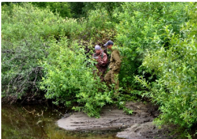
Исследования в Касмалинском заказнике

С 2015 году проект реализован при поддержке гранта Русского географического общества. В рамках проекта обобщены данные по биоразнообразию и редким видам растений и животных в ленточных борах Алтайского края, проведена биологическая инвентаризация заказников краевого значения, расположенных в ленточных борах; выявлены наиболее ценные в природоохранном отношении участки.