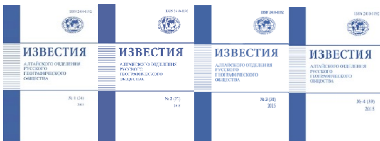
Выпуски Известий АО РГО за 2015 г.: №1(36) – 4(39)

Средство массовой информации "Известия Алтайского отделения Русского географического общества" зарегистрировано 10 декабря 2014 года в форме распространения "печатное СМИ журнал". Выдано свидетельство о регистрации СМИ ПИ № ТУ 22 - 00534 от 10.12.2014. С 2015 г. периодичность издания – 4 раза в год. Изданию присвоен международный стандартный номер ISSN 2410-1192. Сборник включен в Российский индекс научного цитирования (РИНЦ), научные статьи размещены в научной электронной библиотеке ( www.elibrary.ru ).