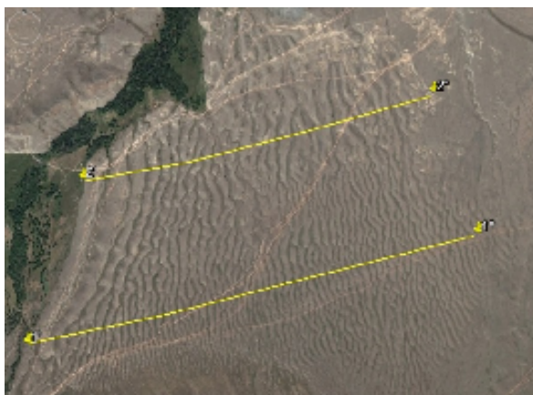
Георадарные профили 1 и 2 по грядовому полю в Курайской котловине Горного Алтая

Во время исследований по гранту РФФИ-РГО в 2015 г. выполнена серия георадарных профилей на четырех грядовых полях – 2-х в Курайской котловине и 2-х в долине Катунь. Профили охватывали грядовые поля полностью, т.е. пересекали 20-30 грядовых цепей, что позволило проанализировать специфику их формирования по длине катастрофического палеопотока.