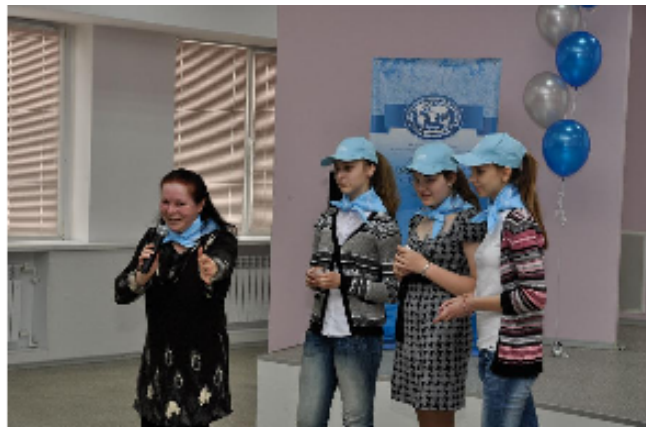
Конкурсы и викторины для участников

Праздник проходил под девизом "Вода и устойчивое развитие". Тема обращает внимание на то, что без воды невозможно гармоничное и сбалансированное развитие, и она влияет на все аспекты для создания будущего.