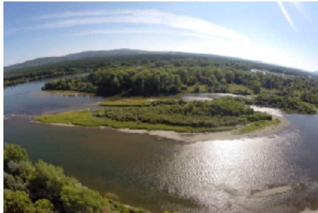
Панорамная съемка с высоты. р. Бия (Красногорский район)

В результате маршрут экспедиции составил более 8 тыс. км, обследовано 40 районов края и отработано около 150 точек. Активное участие в поисково-исследовательской работе по проекту приняли местные жители и члены Русского географического общества.