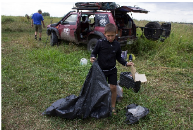
Уборка берега оз. Дальнее