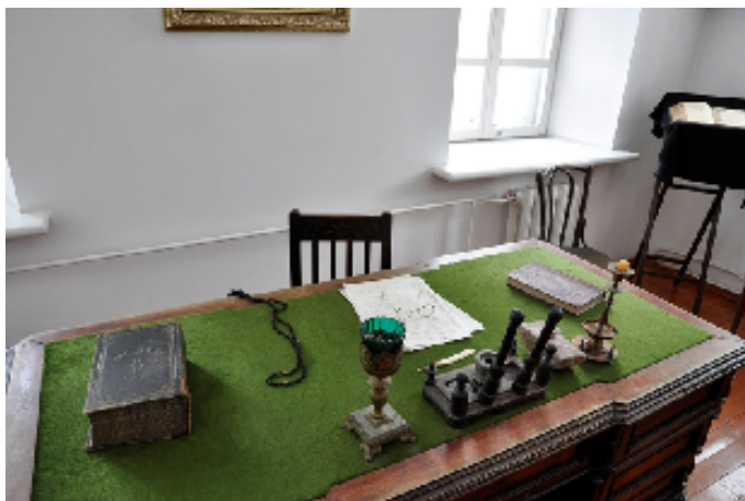
Экспозиция музея «Кабинет бийских архиереев»