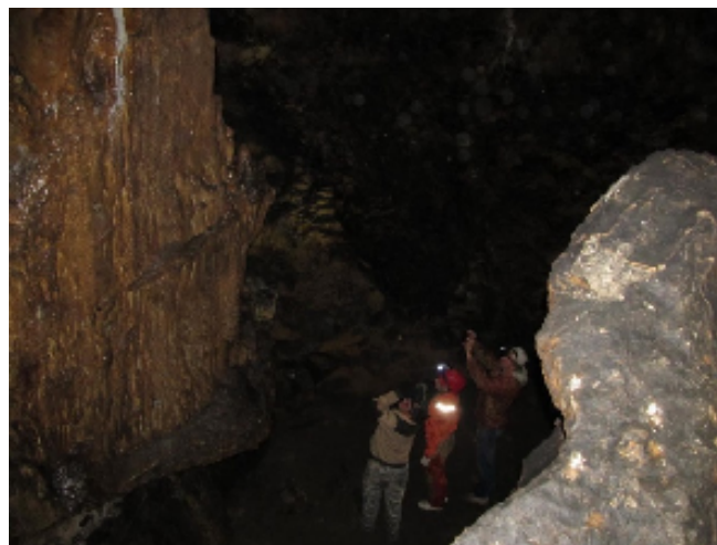
Экспедиция проекта «Белые пятна Чарышских подземелий»

В рамках экспедиции состоялось обследование пещеры Большая Дальняя (с. Чинета) и оценка ее экологического состояния.