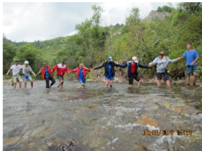
Заповедный паратуризм. Тигирек

Молодые люди с инвалидностью в течении 8 дней знакомились с природным и историческим наследием региона, обучались основам, технике и безопасности пешего туризма, общались и обеспечивали жизнедеятельность коллектива в неподготовленной природной среде.