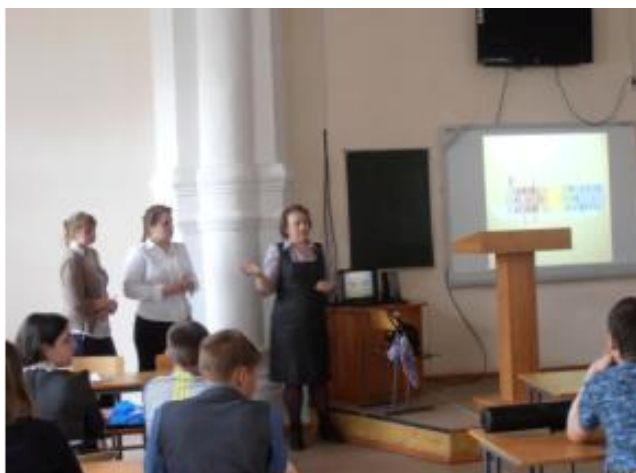
Интеллектуальная модульная экспедиция «Великолепная пятерка»

В игре приняли участие команды 10 образовательных учреждений города и команды МКОУ «Большеугрениевская СОШ», МБОУ «Верх-Катунская СОШ», МБОУ «Первомайская СОШ №2» Бийского района Алтайского края.