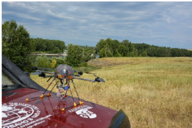
Участники экспедиции в Чарынской степи (Шипуновский район)