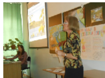
Коллектив педагогов МБОУ "СОШ №81", г. Барнаул. 3 место

Всем участникам конкурсов подготовлены сертификаты, а для победителей – дипломы и призы.