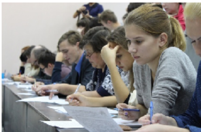
Площадка Алтайского государственного университета

В Алтайском крае для проведения диктанта были организованы две площадки: на базе географического факультета в Алтайском государственном университете и естественно-гуманитарного факультета Алтайского государственного технического университета.