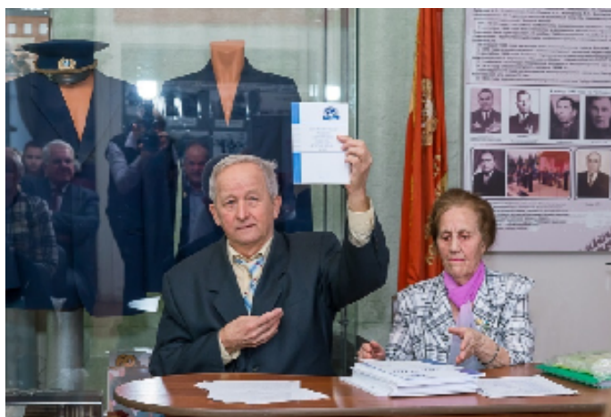
Презентация книги, посвященной 60-летию Алтайского отдела Русского географического общества в г. Бийске