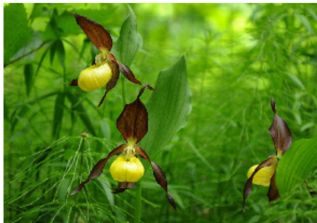
Венерин баимачок настоящий

В результате проекта подготовлены предложения по функциональному зонированию существующих ООПТ и оптимизации их режимов.